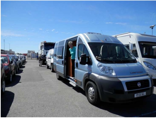
Endlich- unser fahrendes Heim ist angekommen