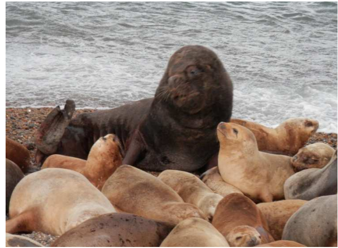
ja schaut nur her, hab ich nicht einen tollen Harem?