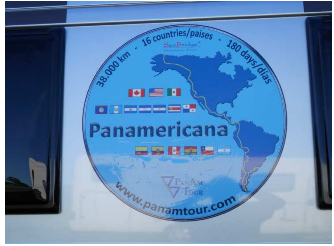
und es kann losgehen