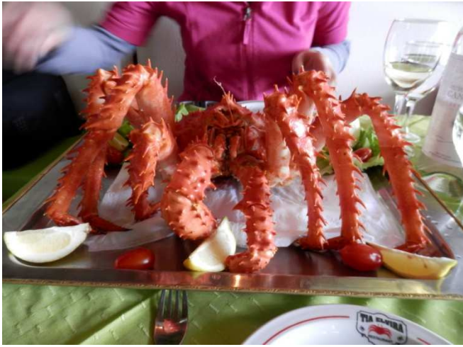
Spezialität in Ushuaia, die Königskrabbe, liessen wir uns nicht entgehen