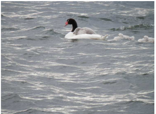
seltener Schwarzhalschwann mit Nachwuchs