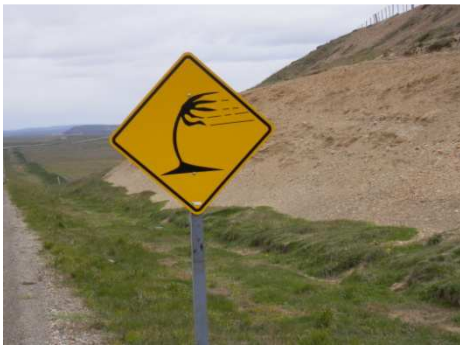
Unglaublich, wie das in Patagonien und auf Feuerland die ganze Zeit „chutet“. Die in eine Richtung schauenden Bäume, nennt man Windflüchter. Würden die wohl gern...