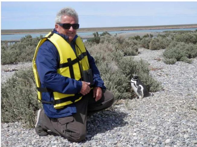
Auf Tuchfühlung mit den Magellan-Pinguinen