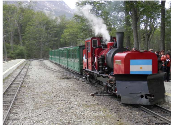
der Zug vom Ende der Welt „trenes del fin del mundo“